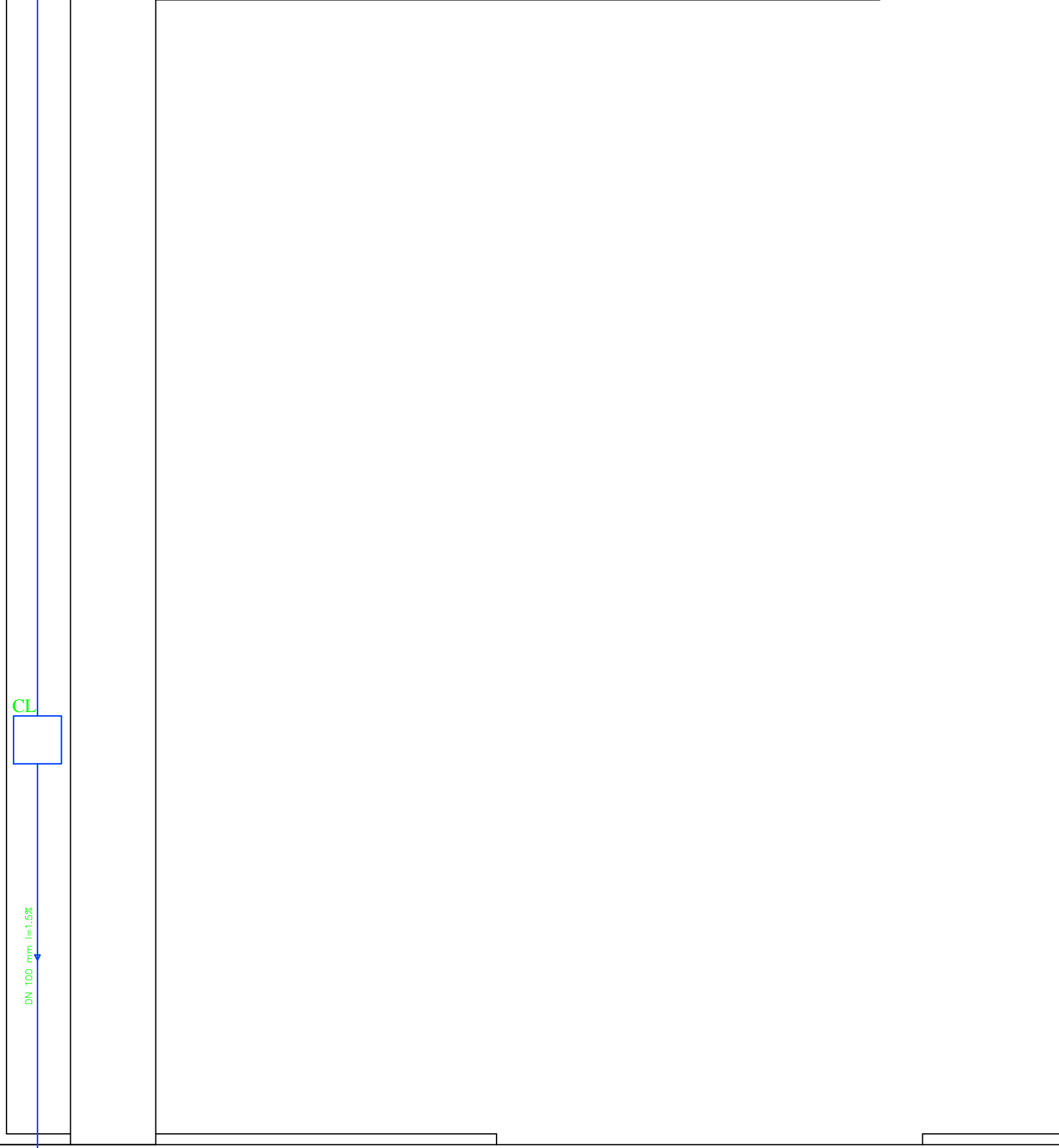
Elevação 01 Escala 1:50