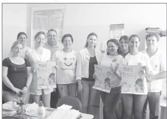
Equipes da Secretaria de Saúde em campanha

informações sobre as principais vias de infecção pelo HIV. Em média, a pessoa infectada pelo HIV demora entre 8 e 10 anos para começar a desenvolver os sintomas de Aids. Só então ela é notificada como um novo caso de Aids.