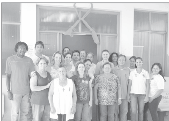
Laço Vermelho na entrada da Secretaria de Saúde: símbolo de conscientização

De acordo com últimos dados divulgados, o Brasil tem, aproximadamente, 600 mil portadores do vírus da Aids, o HIV. Dos 600 mil portadores do HIV, incluem-se as pessoas que já desenvolveram Aids e excluem-se os óbitos. Diferente da notificação dos casos de Aids, os dados de HIV são estimados, portanto, não estão disponíveis