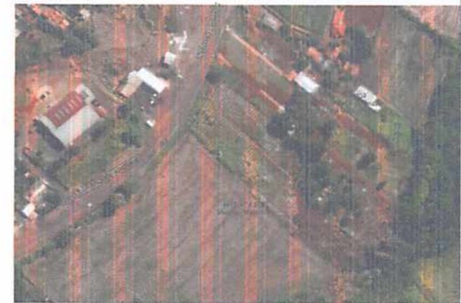
2 IMPLANTAÇÃO ESCALA - 1:2000

TRECHO km: 58+300m Coord: 23° 07' 33,9" S 50° 22' 54,9" W